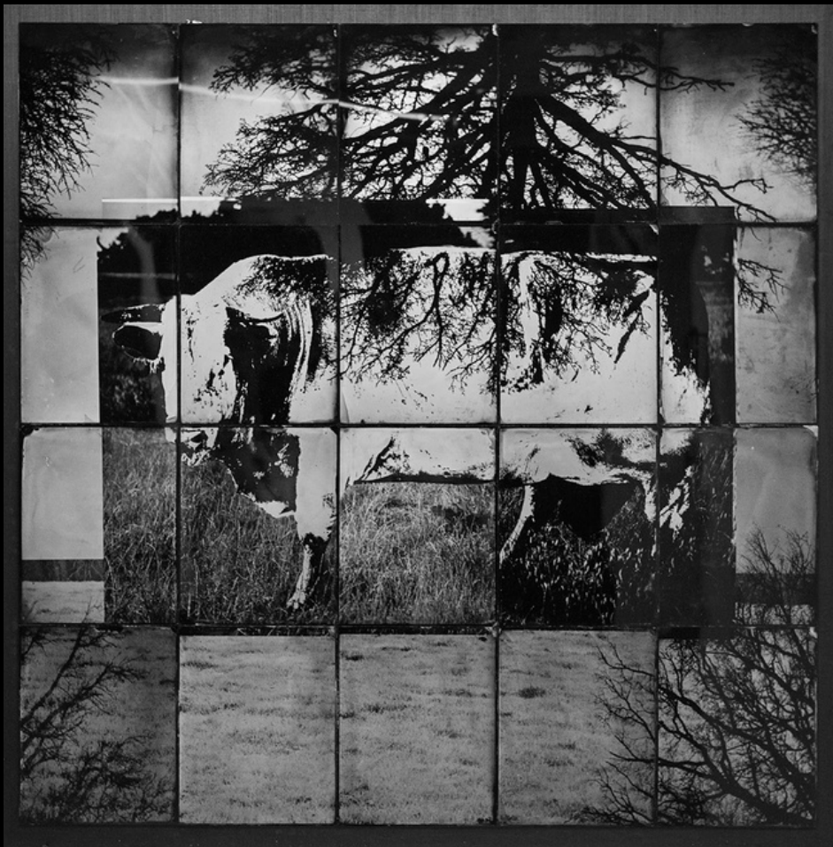
Taureau acrylotypes, 100 x 100 cm 2022