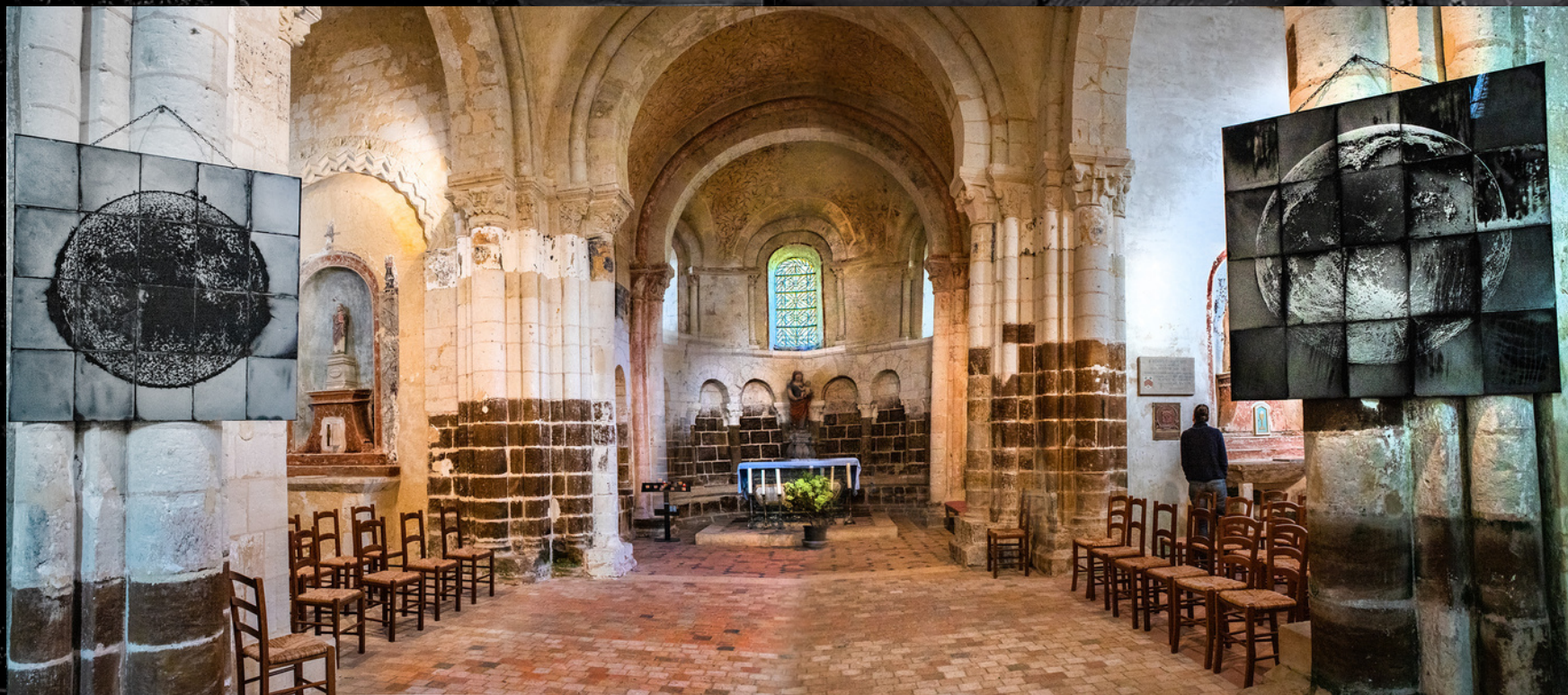
Des astres, dyptique acrylotypes, 100 x 100 cm 2021