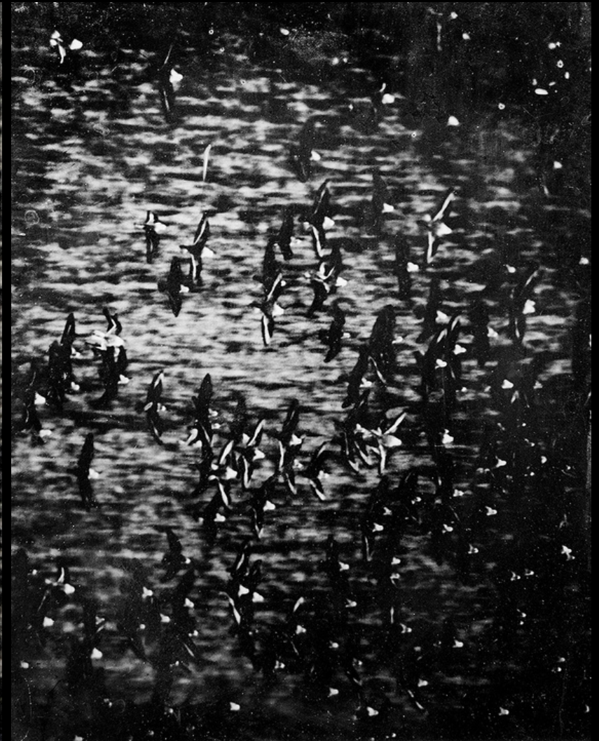
Derrière mes paupières, le vol des oiseaux - dyptique ambrotypes, 20 x 25 cm 2022