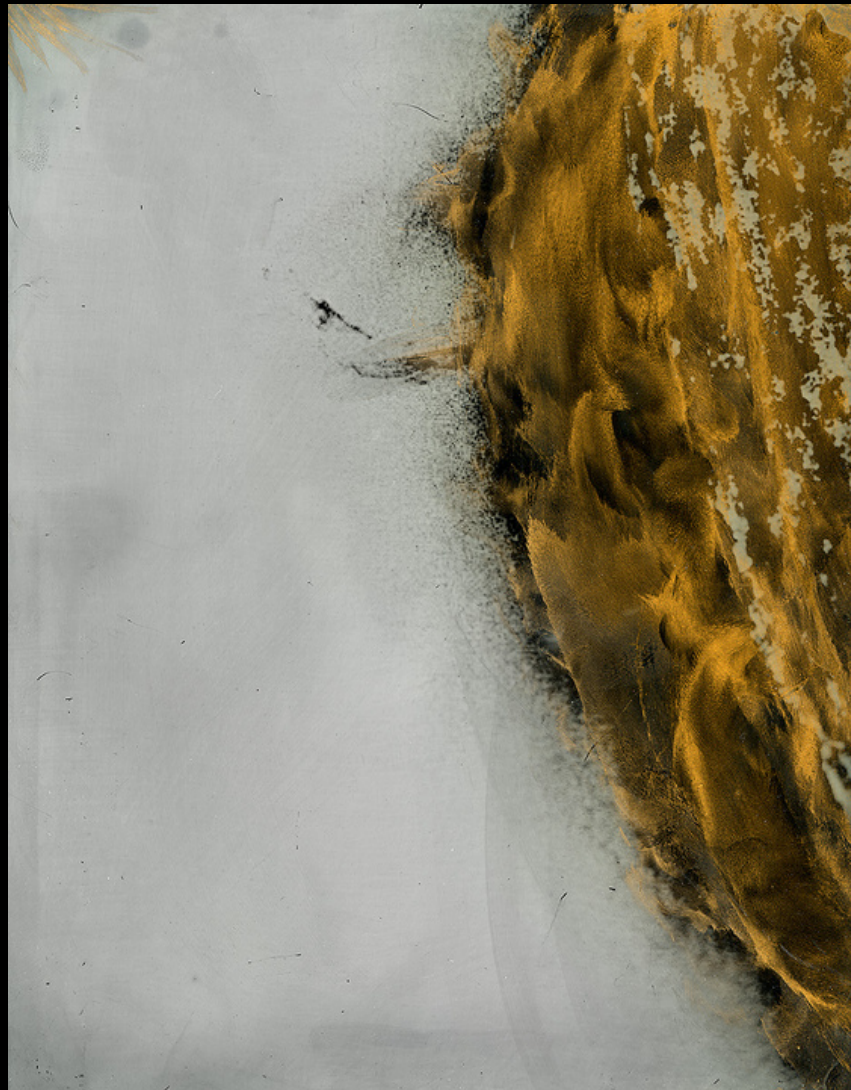
Quartier de soleil acrylotype et vernis or 20 x 25 cm

Actif dans plusieurs collectifs d'artistes et d'artisans d'art, il exposera dans les Parc Régionaux du Perche, puis celui de Normandie-Maine durant l'été 2023 avant d'aborder le festival Cithem fin août à Alençon.